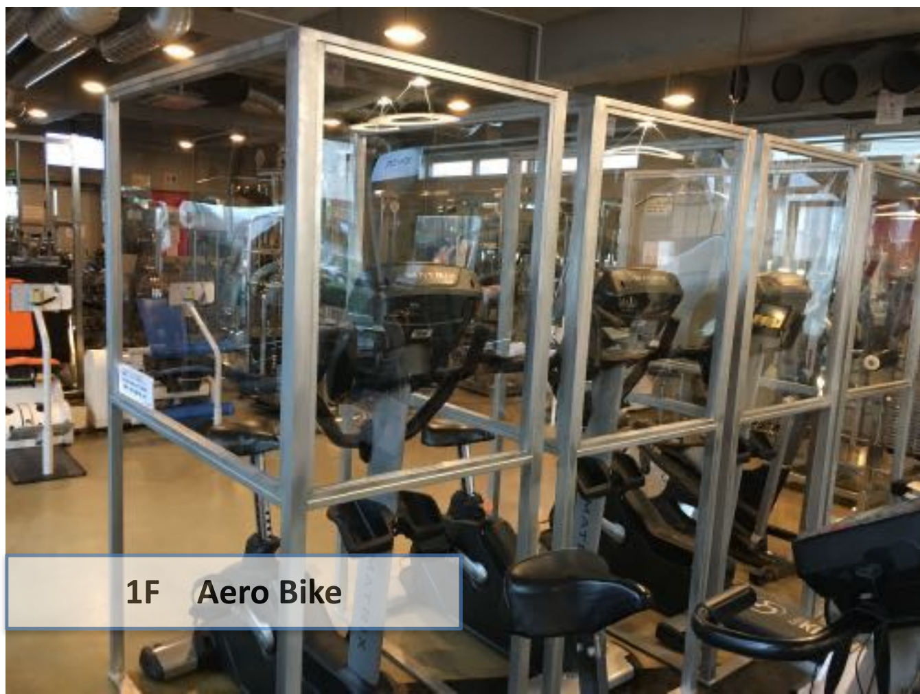
1F Aero Bike