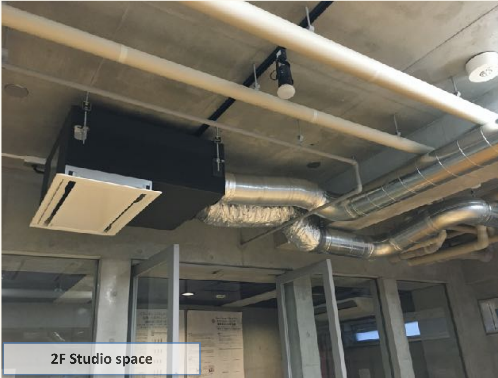
2F Studio space