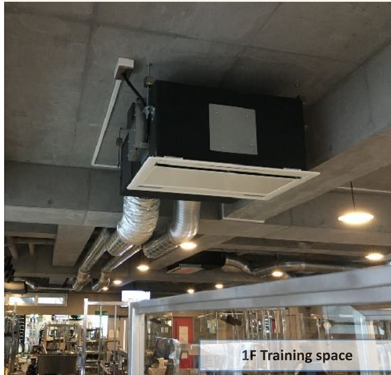
1F Training space