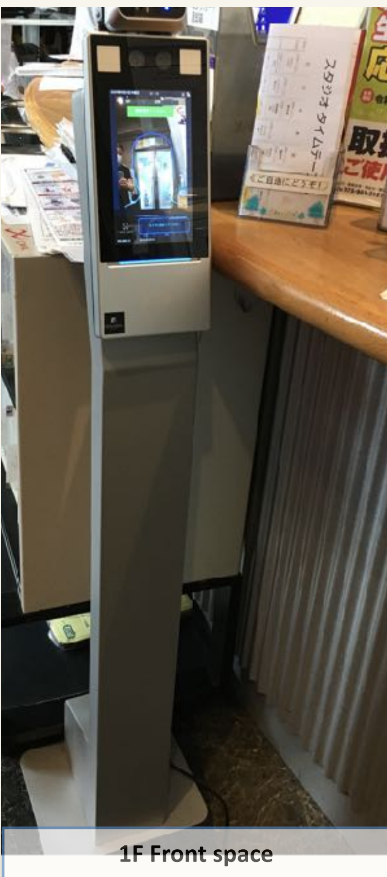
1F Front space